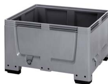
PC600PP4P : avec pieds

Les caisses-palettes sont réalisées en plastique robuste, résistant aux éraflures. Des surfaces de parois intérieures et extérieures lisses garantissent un nettoyage sans problèmes.