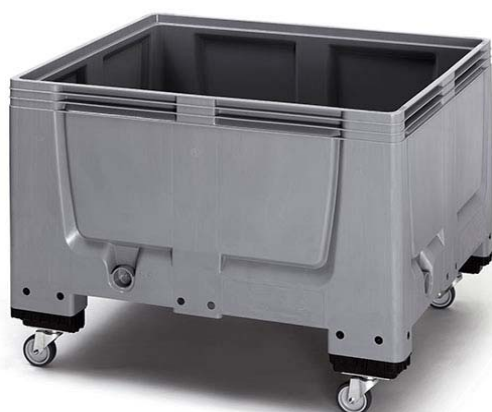
PC600PP4R : avec roulettes