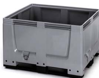
PC600PP3S : avec semelles